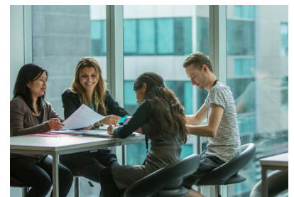
继续工作 2 年