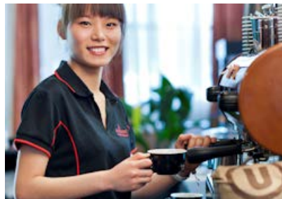
全职工作 1 年