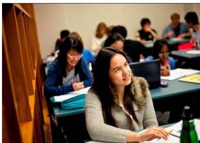
学习+工作 1 年